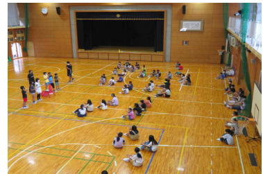
ペア活動（児童会主催）

2学期の始業式では、体も心も一回り成長した子どもたちに会えることを楽しみにしています。〈校長〉