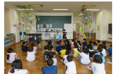
たなばた集会（2年生）