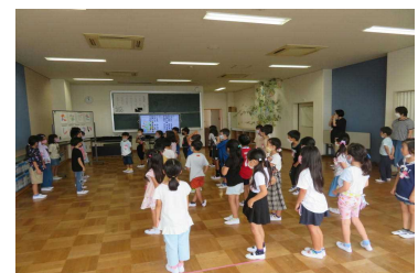
たなばた集会（1年生）