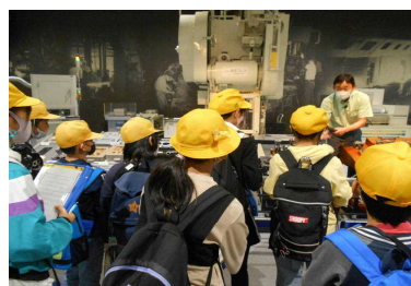
5年 トヨタ産業技術記念館