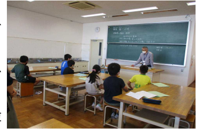
4年 キャリア教育出前授業

バスを利用した校外学習を実施しました。目的地では係の方からお話を聞いたり、実物や展示物を見たり、触れたりしました。また、短い時間ですが、グループに分かれて活動することもできました。〈校長〉