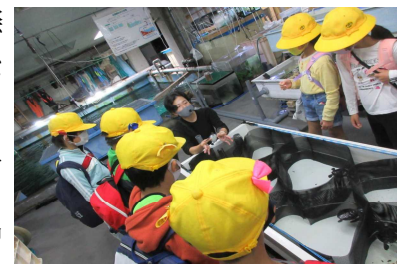
1年 南知多ビーチランド