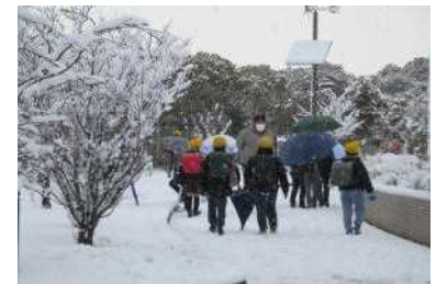
雪の日の登校の様子