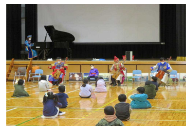
2年 馬頭琴出前授業