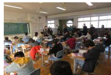
学校運営協議会(校内見学)