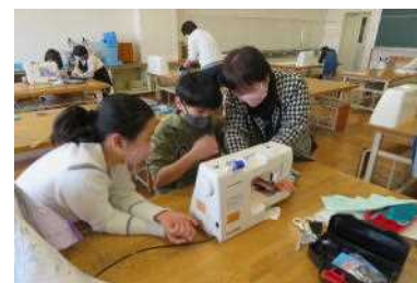
ミシンボランティア